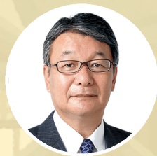
山本 順三 参議院議員