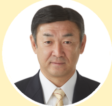
監査 若江 進 松山市市議会議員