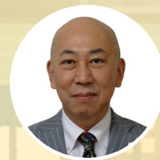
松本 一志 (有) シーアールシー