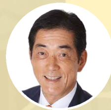
中村 時広 愛媛県知事